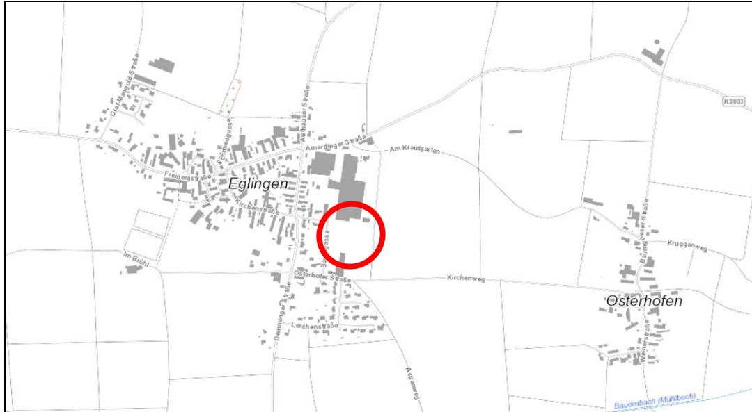
Lage des Plangebiets am Eglinger Ortsrand 1

Am östlichen Ortsrand von Eglingen ist der Betrieb Grinbold-Jodag angesiedelt. Aufgrund der guten Entwicklung des Betriebs wurden die betrieblichen Anlagen bereits parallel zum Aufstellungsverfahren „Gewerbegebiet Schrai – Änderung“ nach Süden erweitert.