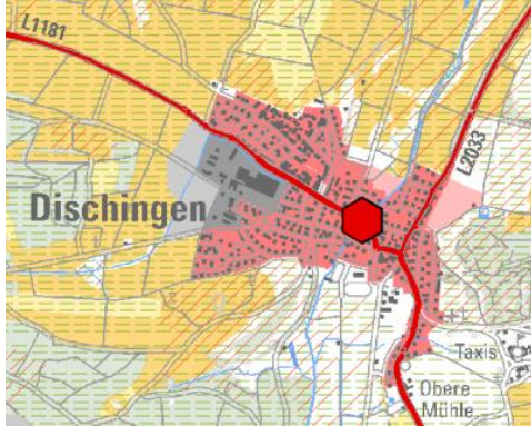
Abbildung 1: Ausschnitt Raumnutzungskarte Entwurf Regionalplan 2035 (unmaßstäblich)

Im Regionalplan 2023 (Entwurf) wird der Geltungsbereich der Siedlungsfläche Bestand - Wohn- und Mischgebiet (N) zugeordnet.