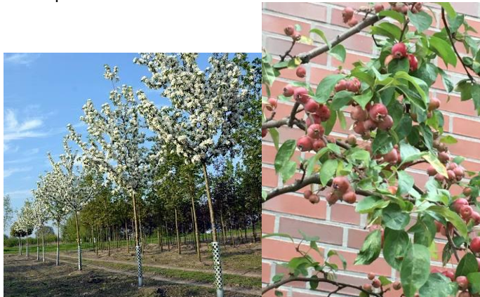
Wildapfel ‚Red Sentinel‘

4-5m hoch, 3-4m breit, kleine rote Früchte, Blüte im Mai weiß, rosa angehaucht, Klimabaum