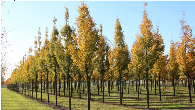
Carpinus betulus ,Frans Fontaine'

5-8m hoch, 3-4m breit, Blüte unscheinbar, Herbstfärbung leuchtend gelb, Klimabaum