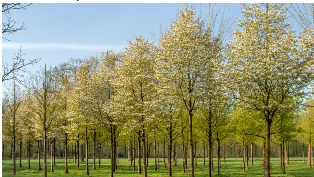
Felsenbirne ‚Robin Hill‘

6-8m hoch, 2-5m breit, längliche schw. Beeren, Blüte weiß, rosa überhaucht im April-Mai, rot-orange Herbstfärbung, Klimabaum