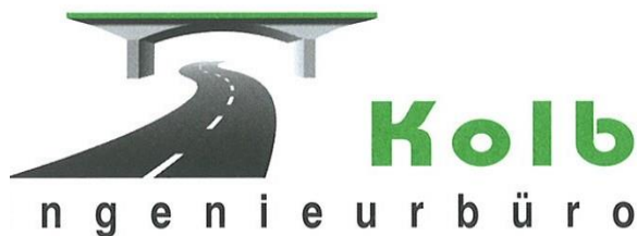
..... Helmut Kolb

Ingenieurbüro Helmut Kolb Zeppelinstraße 10 89555 Steinheim am Albuch Telefon: 073 29 - 92 03 - 0 Telefax: 073 29 - 92 03 - 29