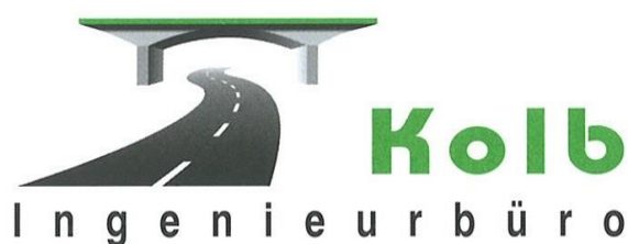
..... Helmut Kolb

Ingenieurbüro Helmut Kolb Zeppelinstraße 10 89555 Steinheim am Albuch Telefon: 073 29 - 92 03 - 0 Telefax: 073 29 - 92 03 - 29