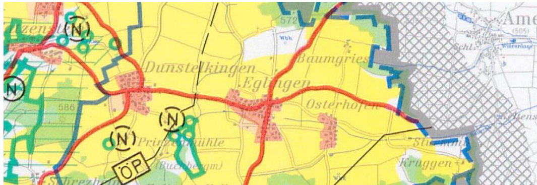
Abb. 1: Ausschnitt Regionalplan Ostwürttemberg 2010

Landwirtschaft und Bodenschutz sind Grundsätze im Regionalplan, die berücksichtigt werden müssen. Ziele der Raumordnung und Regionalplanung sind nicht betroffen. Das Vorhaben entspricht den Zielen der Raumordnung.