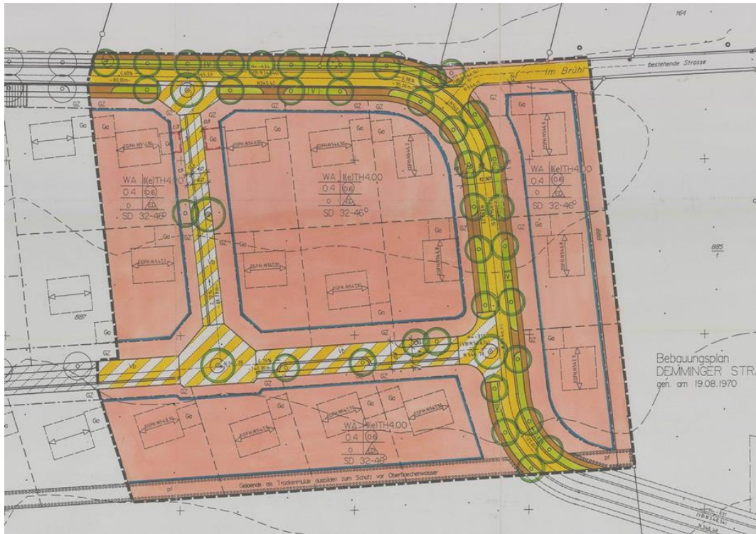
Abb. 4: Ausschnitt Bebauungsplan „Blasenfeld“ von 1994, Gemeinde Dischingen