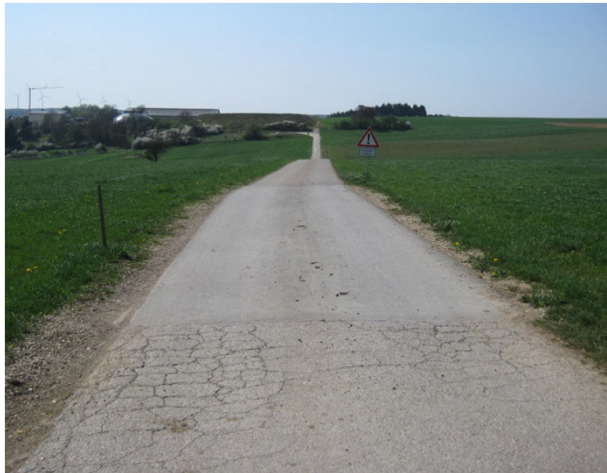
Ansicht von Ost