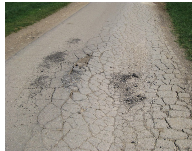
Starke Verdrückung mit Ausbrüchen