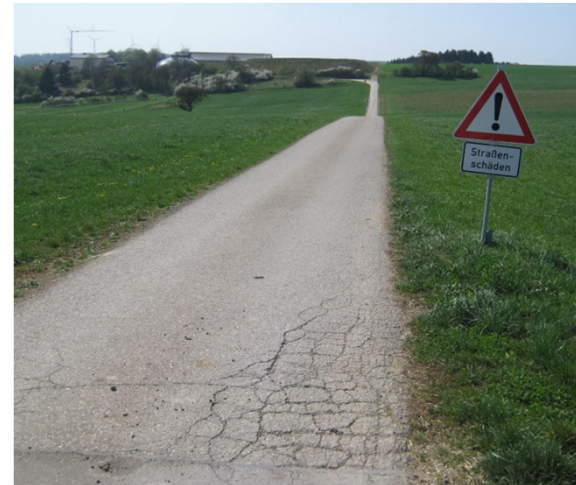
Netzrisse im Randbereich