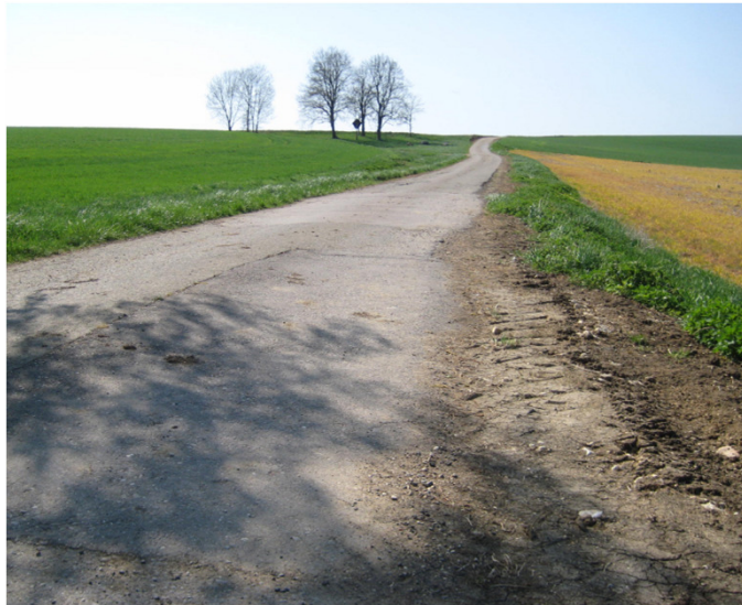
Blick von der Kreisstraße