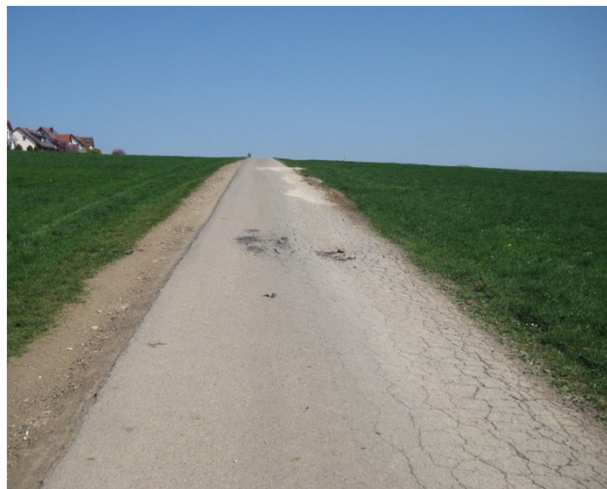
Ansicht von West