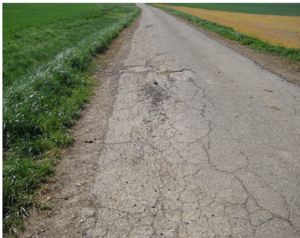
Starke Verdrückungen und Netzzrisse