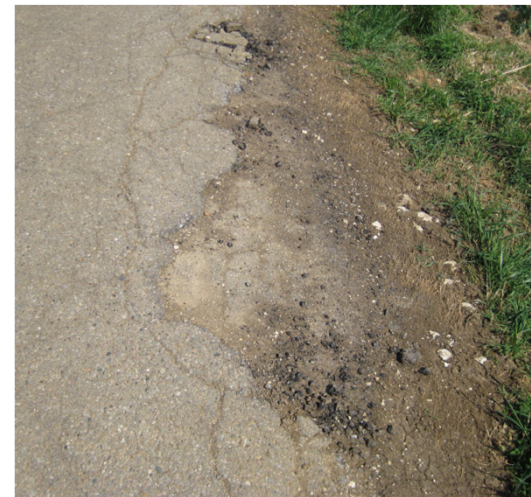
Belagsaufbrüche, fehlende Bankette