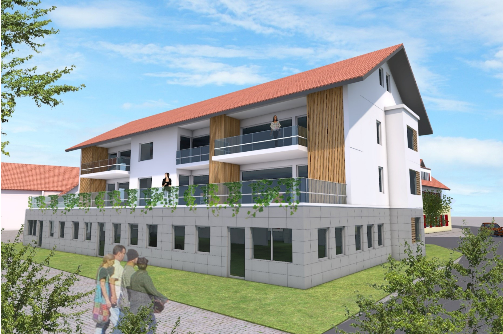
Ärztehaus Dischingen / Perspektive 2