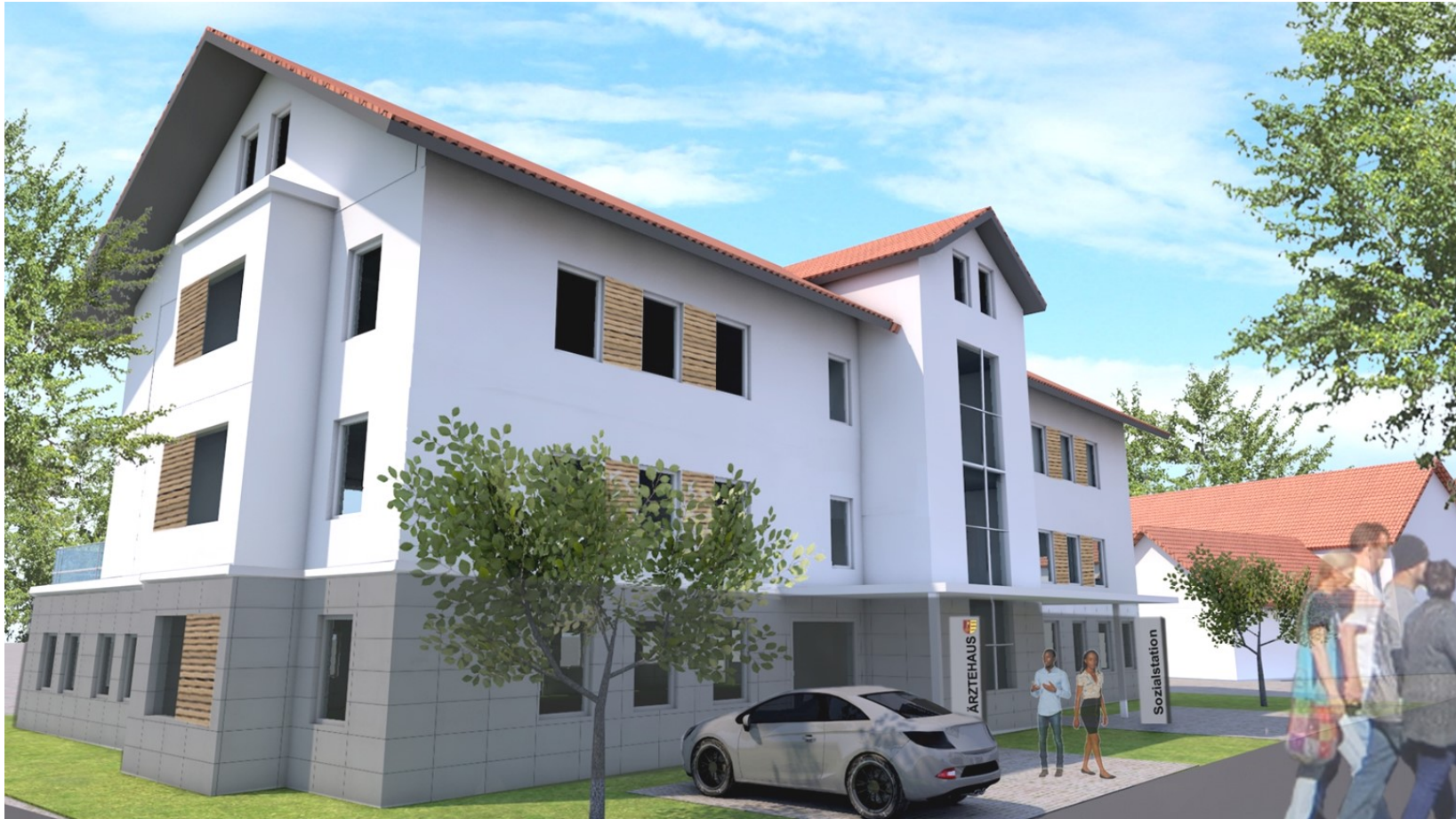
Ärztehaus Dischingen / Perspektive 1