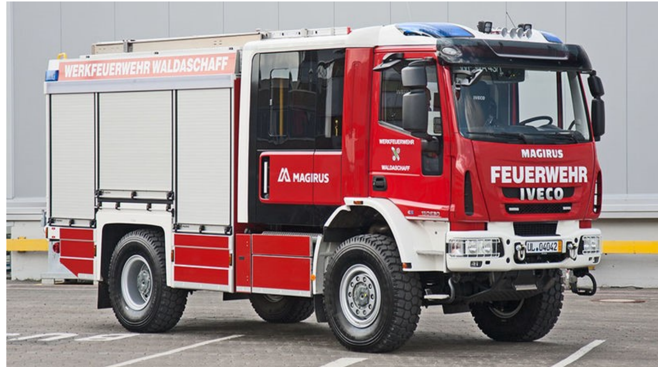
Beispielfoto, Iveco Magirus AG

235 kW, Euro 6, automatisiertes Schaltgetriebe