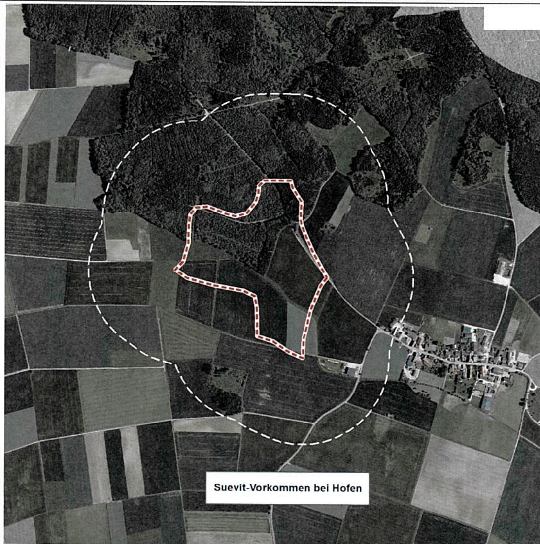
Suevit-Vorkommen bei Hofen